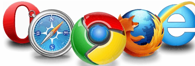
شکل ۶- پشتیبانی از کلیه مرورگرها

غ پشتیبانی از کلیه به‌روزرسانی‌های انجام‌شده در نرم‌افزار Microsoft Dynamics CRM