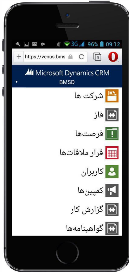
شکل ۴- پشتیبانی فارسی‌ساز از نسخه موبایل CRM